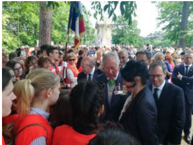
Le Président le la Red Cross britannique en la personne du prince de Galles (Prince Charles) (8 mai 2018 à Lyon)